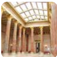
Bild: Große Säulenhalle im Wiener Parlament