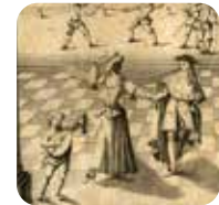
Bild: Ritter-Exercitien-Lexicon, 1742, Universitätsbibliothek Salzburg

44 Universitätsbibliothek Salzburg Hofstallgasse 2–4 5020 Salzburg www.plus.ac.at/uni-bibliothek | www.ddmarchiv.eu 0662 / 80 44–77340