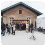
Bild: Architekturhaus Salzburg