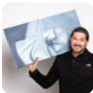
Bild: Porträt des Künstlers